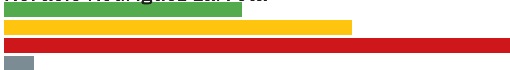
Horacio Rodríguez Larreta