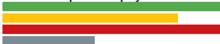
Ricardo López Murphy