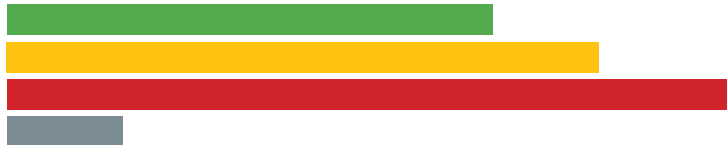
Horacio Rodríguez Larreta